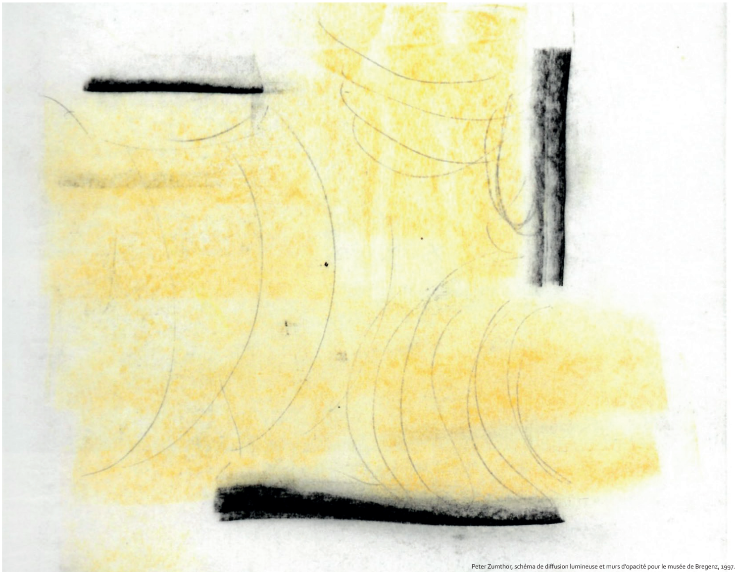
Peter Zumthor, schéma de diffusion lumineuse et murs d'opacité pour le musée de Bregenz, 1997.